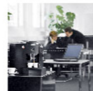
Stilvolle Erweiterung im Büro und bei Seminaren