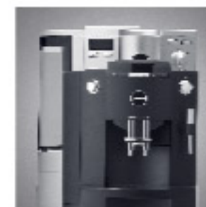
Kompakt und formschön