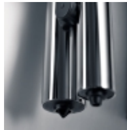
One Touch Cappuccino-Düse